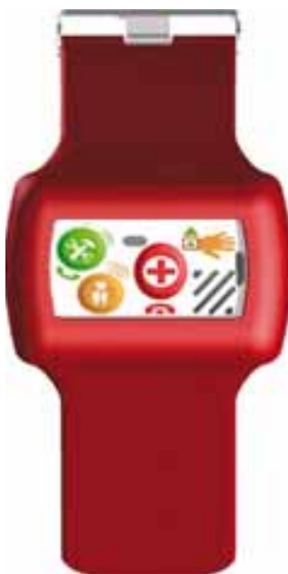
Elektromický Dohledový Asistent (EDA)

Řekl bych, že prodát se dá všechno, ale my chceme a věříme, že prodávát se dá jen kvalitní produkt. Neziskovka je v úplně stejné pozici – také má svůj produkt, jen ho prodává jinému publiku. Musí pak ukázat lidem, že její činnost je skutečně prospěšná a že jí dělá dobře. V momentě, kdy se dosáhne takového projektu – má pozitivní reference a je už nějak vnímán na veřejnosti, tak začnou přicházet i příjmy, protože najednou se víc subjektů rozhodne na něm participovat. Hodně firem má marketingové budgety na „rozumnou činnost“, ale je pro ně těžké zorientovat se v obrovském množství těchto činností. Proto musí být projekt kvalitní, aby vyčníval z toho moře nekvalitních.